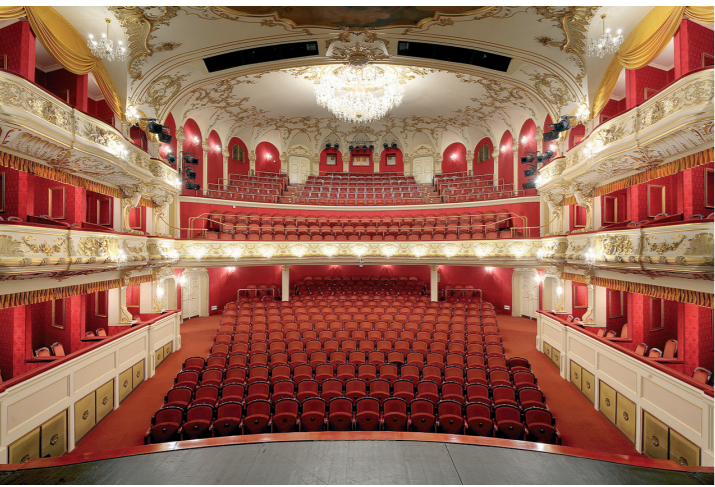
Divadlo Antonína Dvořáka